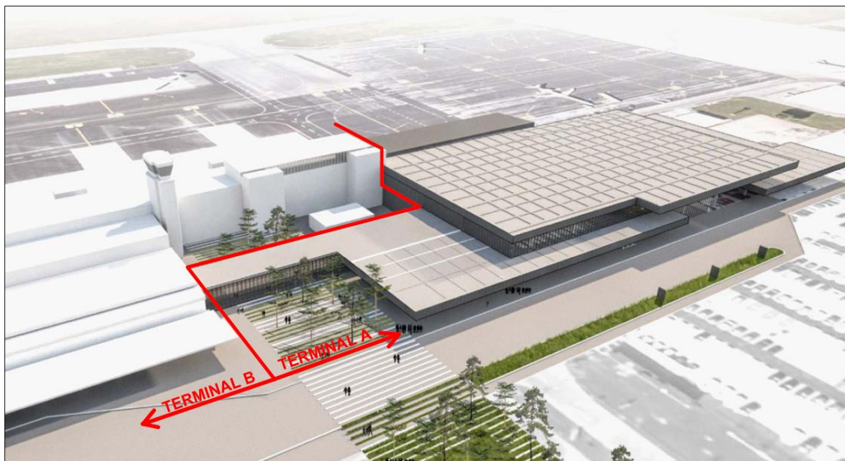
Slika 1: Potniški terminal

3.6.3 V pritličju odhodnega dela potniškega terminala, se nahaja 23 prijavnih okenc za prijavo na let (8 v starem (B) delu ter 15 v novem (A) delu). Od tega je eno prijavno okence namenjeno oddaji izven dimenzijske prtljage. Enako velja za prodajna okenca prevoznikov, ki se nahajajo tako v A kot tudi B delu. V B delu so praviloma umeščeni nizkocenovni in čarter prevozniki.