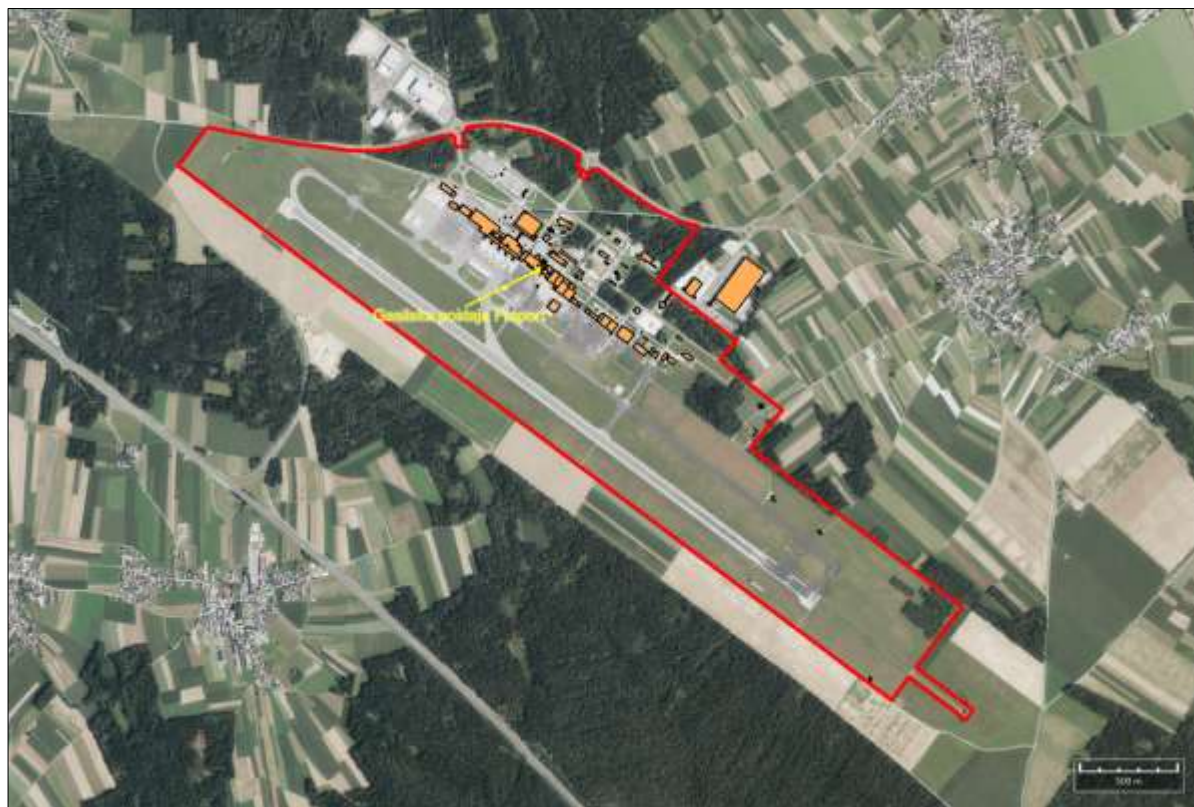
Slika 3: Območje delovanja gasilsko reševalne službe Fraporta Slovenija

12.11.2 Uporabniki letališča morajo upoštevati vso zakonodajo glede varstva pred požarom.