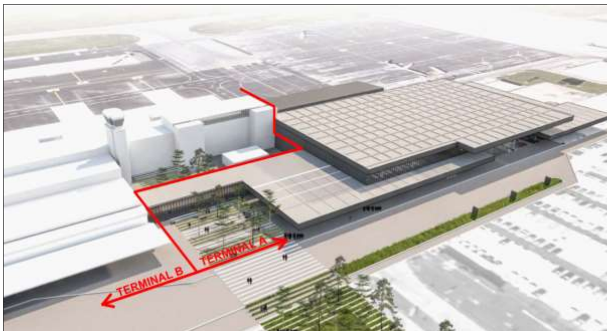
Slika 1: Potniški terminal

3.6.3 V pritličju odhodnega dela potniškega terminala, se nahaja 23 prijavnih okenc za prijavo na let (8 v starem (B) delu ter 15 v novem (A) delu). Od tega je eno prijavno okence namenjeno oddaji izven dimenzijske prtljage. Enako velja za prodajna okenca prevoznikov, ki se nahajajo tako v A kot tudi B delu. V B delu so praviloma umeščeni nizkocenovni in čarter prevozniki.